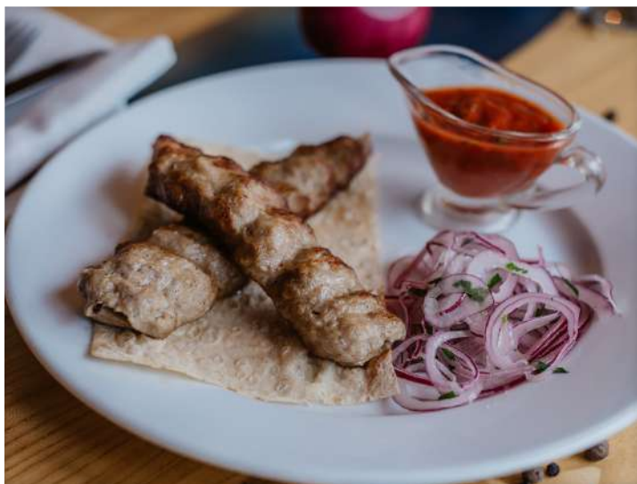
Люля-кебаб из баранины Баранина, соль, перец, курдюк, лук (160 г/85 г) 400 р. Акция: специальная цена