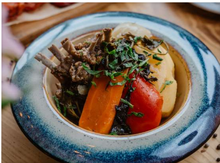
Дымлама с козлёнком тушеное с овощами мясо козлёнка. Только в пт, сб, вскр с 12:00 (350 г) 350 р.