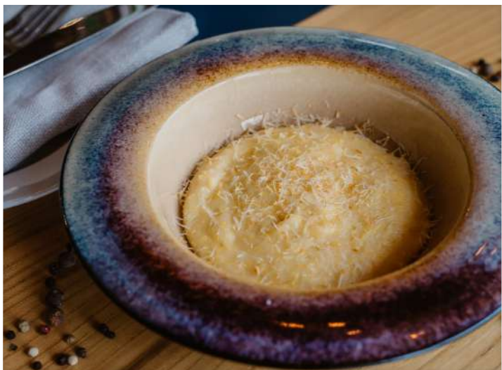
Эларджи кукурузная крупа по древнему грузинскому рецепту с домашним сулгуни. Только в пт, сб, вскр с 12:00 (120 г) 195 р.