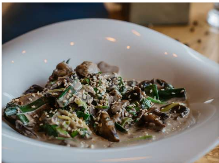
Баратилли бараньи язычки в сливочном соусе с кунжутом и зеленью (350 г) 390 р.